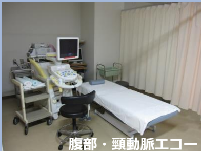
腹部・頸動脈エコー