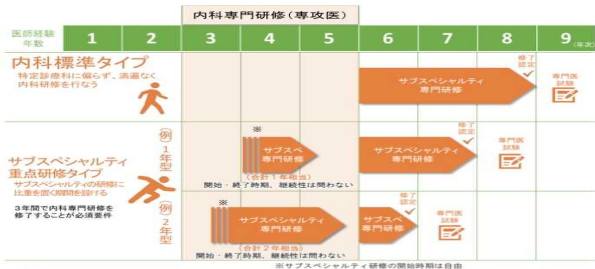
図 2.内科専門研修とサブスペシャリティ専門研修の連動研修（概念図）

なお、内科専門研修終了の要件を満たす限りにおいて、サブスペシャリティ分野の専門研修を平行あるいは混合して研修することも可能です。一例として、内科専門研修 3年間のうち 1～2年間にサブスペシャリティ重点研修とする概念図を示します。（図 2）